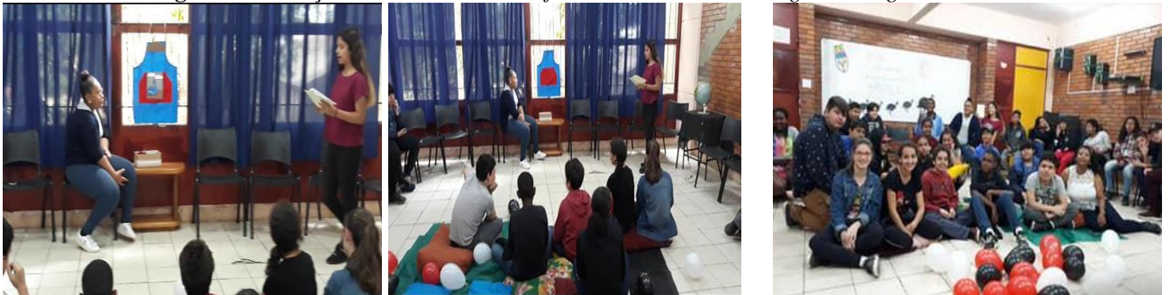
Figura 5: Contação de história Contos Africanos de Países de Língua Portuguesa