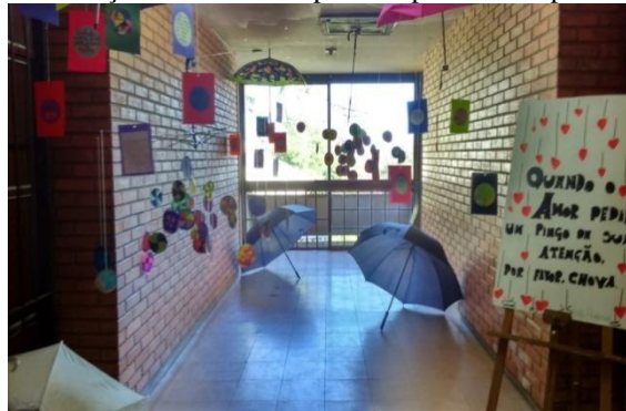
Figura 16: Instalação artística com poemas produzidos pelos alunos.