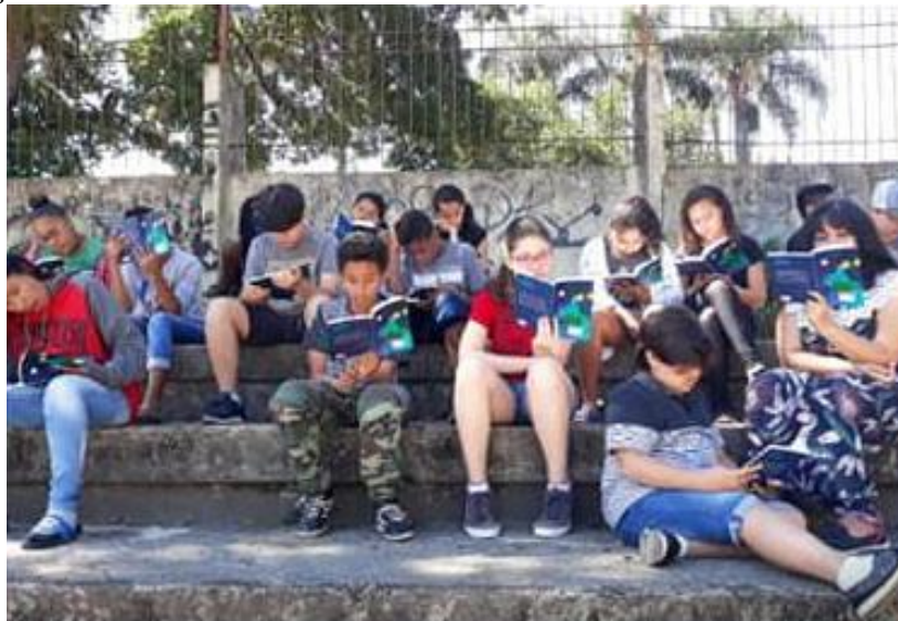
Figura 3: Atividade inicial do Seminário de Leitura do Primeiro Trimestre de 2020.