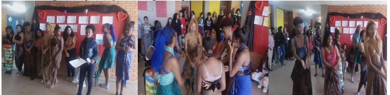
Figura 8: Apresentação de coreografia inspirada no conto Dandara e a Princesa Perdida .