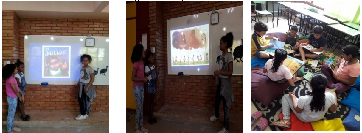
Figura 6: Contação de história Sulwe .