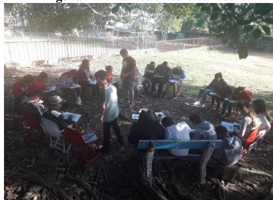
Figura 9: Dinâmica Árvore da vida .