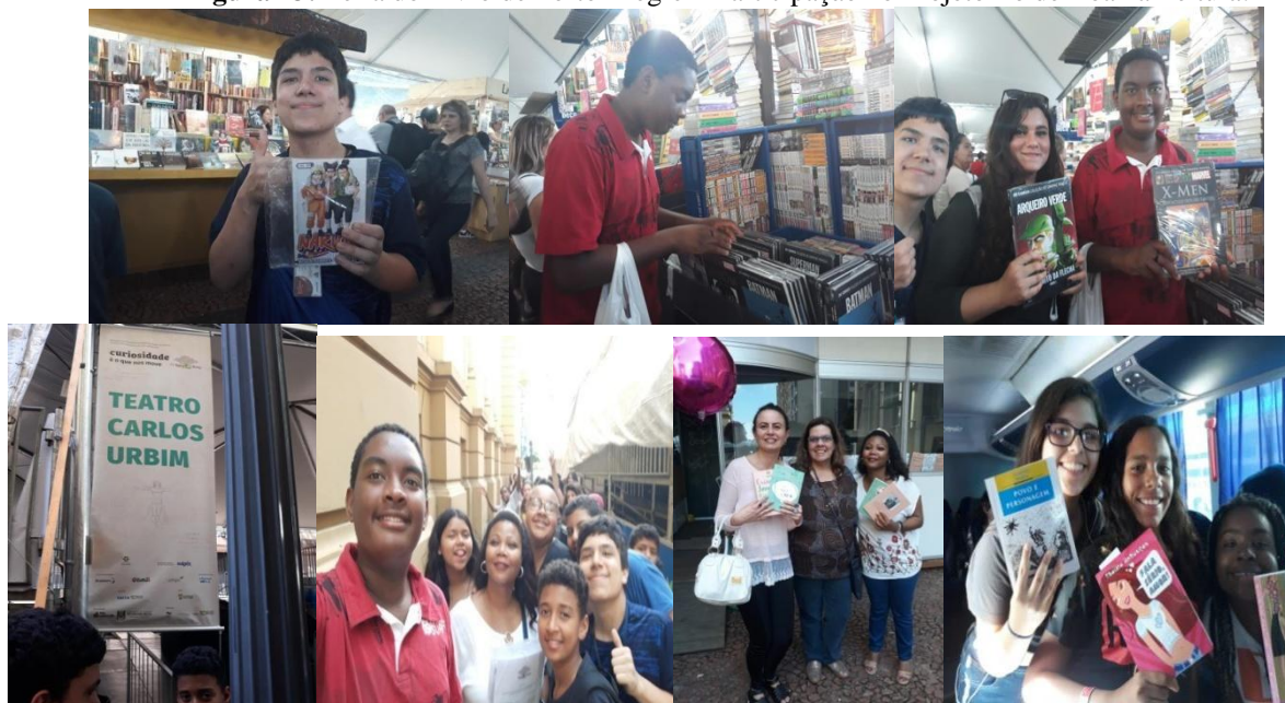
Figura 13: Feira do Livro de Porto Alegre – Participação no Projeto Tô de Boa na Leitura.