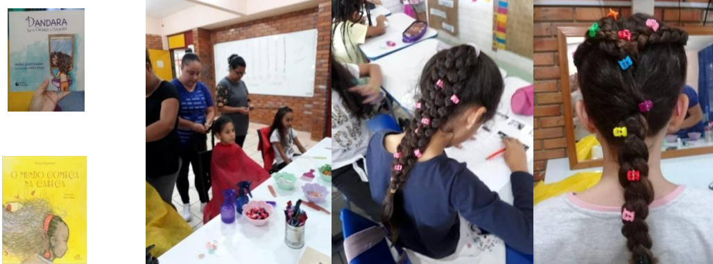
Figura 12: Oficina de tranças ministradas por mães parceiras da escola.