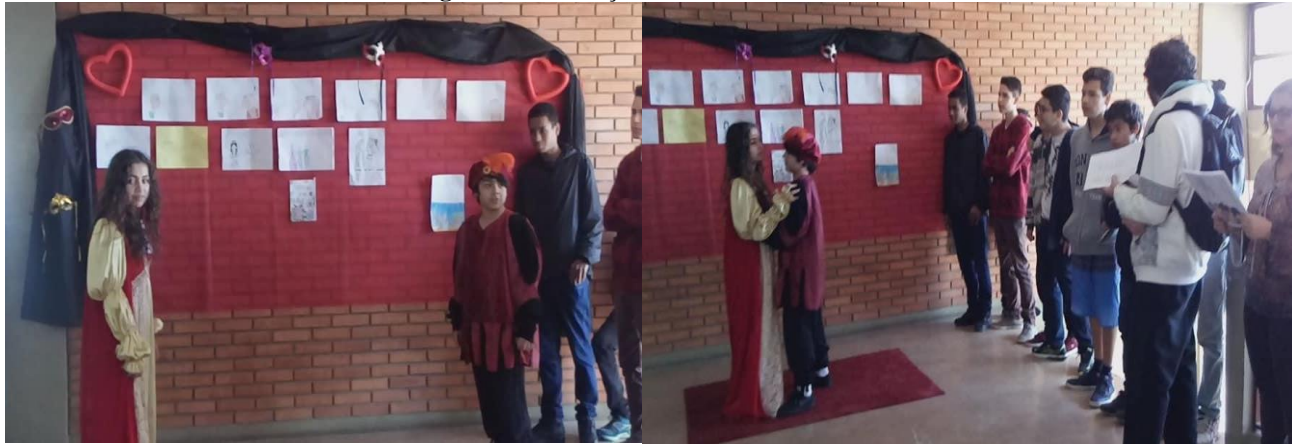
Figura 7: Encenação de Romeu e Julieta