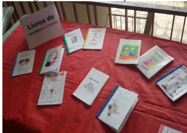
Figura 15: Livros elaborados pelos alunos.