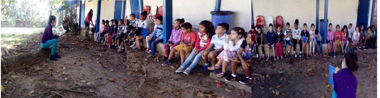
Figura 4: Contação de história Reinações de Narizinho , de Monteiro Lobato.