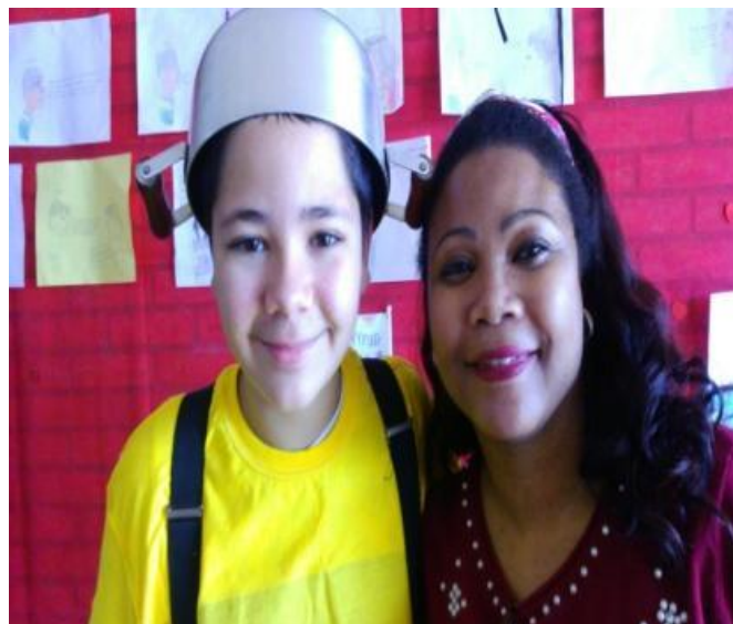
Figura 17: Apresentação teatral “Menino Maluquinho”.